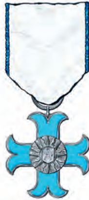
însemn și panglică (avers)

al Ordinului Meritul pentru Promovarea Drepturilor Omului și Angajament Social , gradul de Cavaler