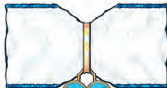
însemn și panglică (avers)