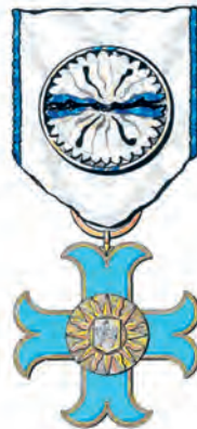
însemn și panglică (avers)

al Ordinului Meritul pentru Promovarea Drepturilor Omului și Angajament Social , gradul de Ofițer