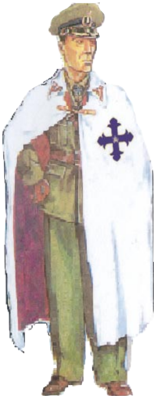
Ofițer activ Cavaler al ordinului în ținută de serviciu