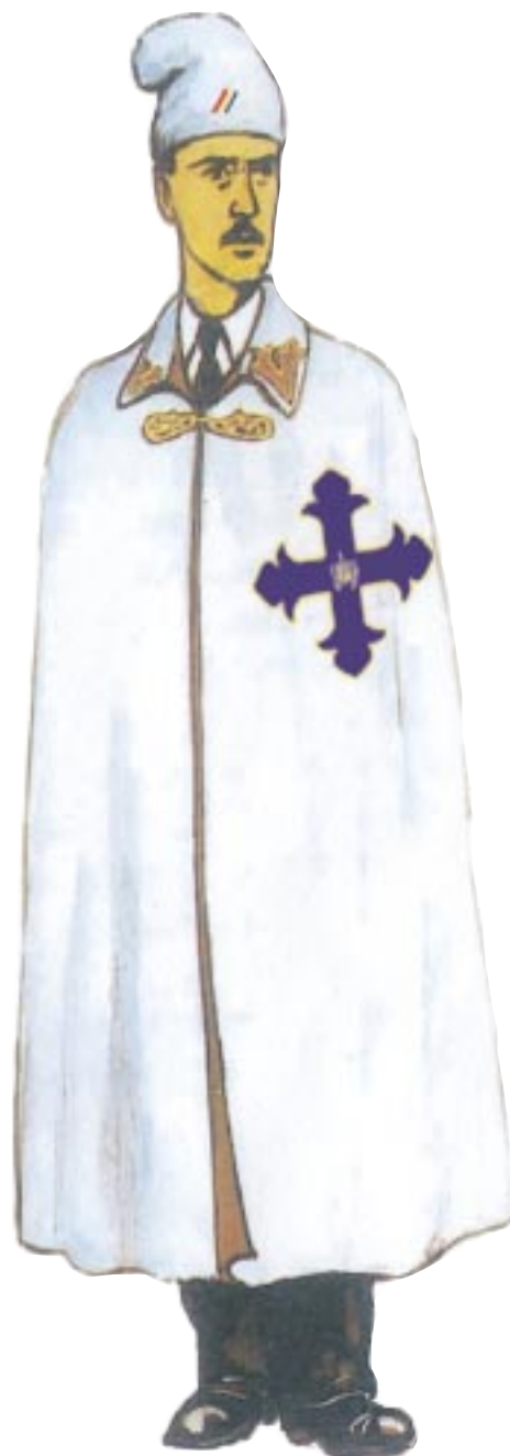
Ofițer în rezervă Cavaler al ordinului