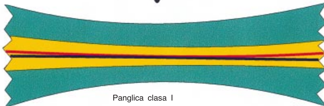
Panglica clasa I