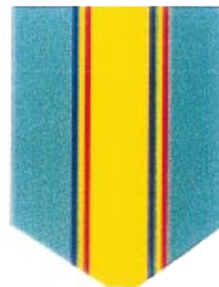
Rozeta clasa a III-a