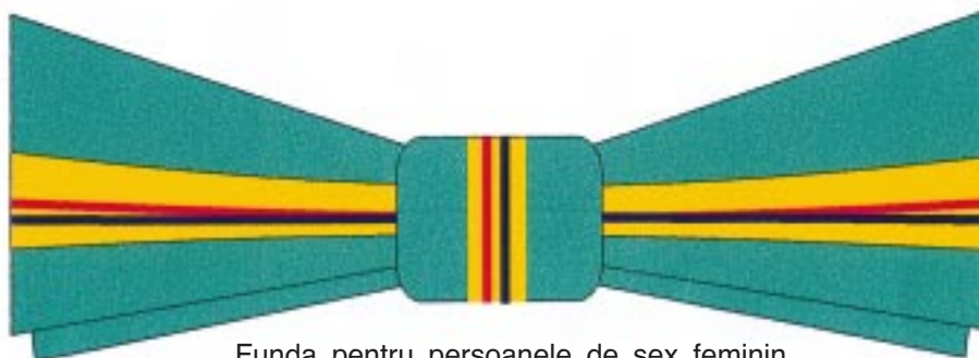
Funda pentru persoanele de sex feminin