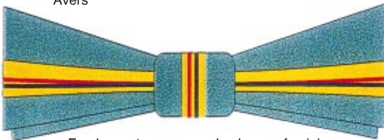
Funda pentru persoanele de sex feminin